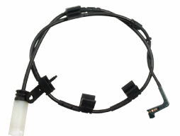
Mini Cooper WS384